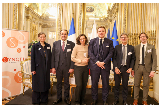
Hôtel de Monaco - Résidence de l'Ambassadeur de Pologne, Paris

Enfin, en partenariat avec la Fondation allemande Genshagen , Synopia a organisé la deuxième édition de son séminaire international sur le Triangle de Weimar (France, Pologne, Allemagne). Celui-ci s'est tenu sur deux jours, les 10 & 11 décembre 2024 , sur le thème de la coopération trilatérale en matière de défense et d'énergie. Avec le soutien de l' Ambassade de Pologne en France , du GICAT , du Centre for Eastern Studies (OSW) , de l' ACADEM , et d' EDF , ce colloque a réuni des personnalités françaises, allemandes et polonaises (représentants politiques, industriels, think tanks et société civile).