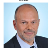
Yves Censi Député honoraire Senior Partner, Mascaret