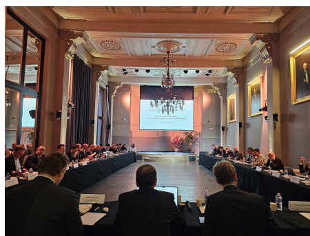
Hôtel de l'Industrie, Paris