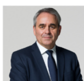
Xavier Bertrand* Président Région Hauts-de-France