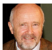
Brice Lalonde Président Équilibre des Énergies